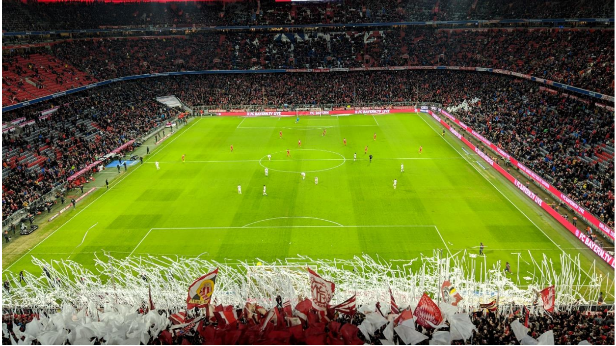
FC Bayern München vs FC Nürnberg pe Allianz Arena