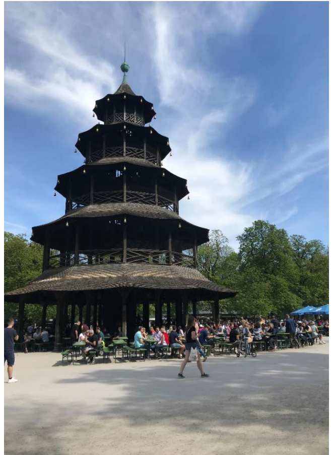
Englischer Garten, München