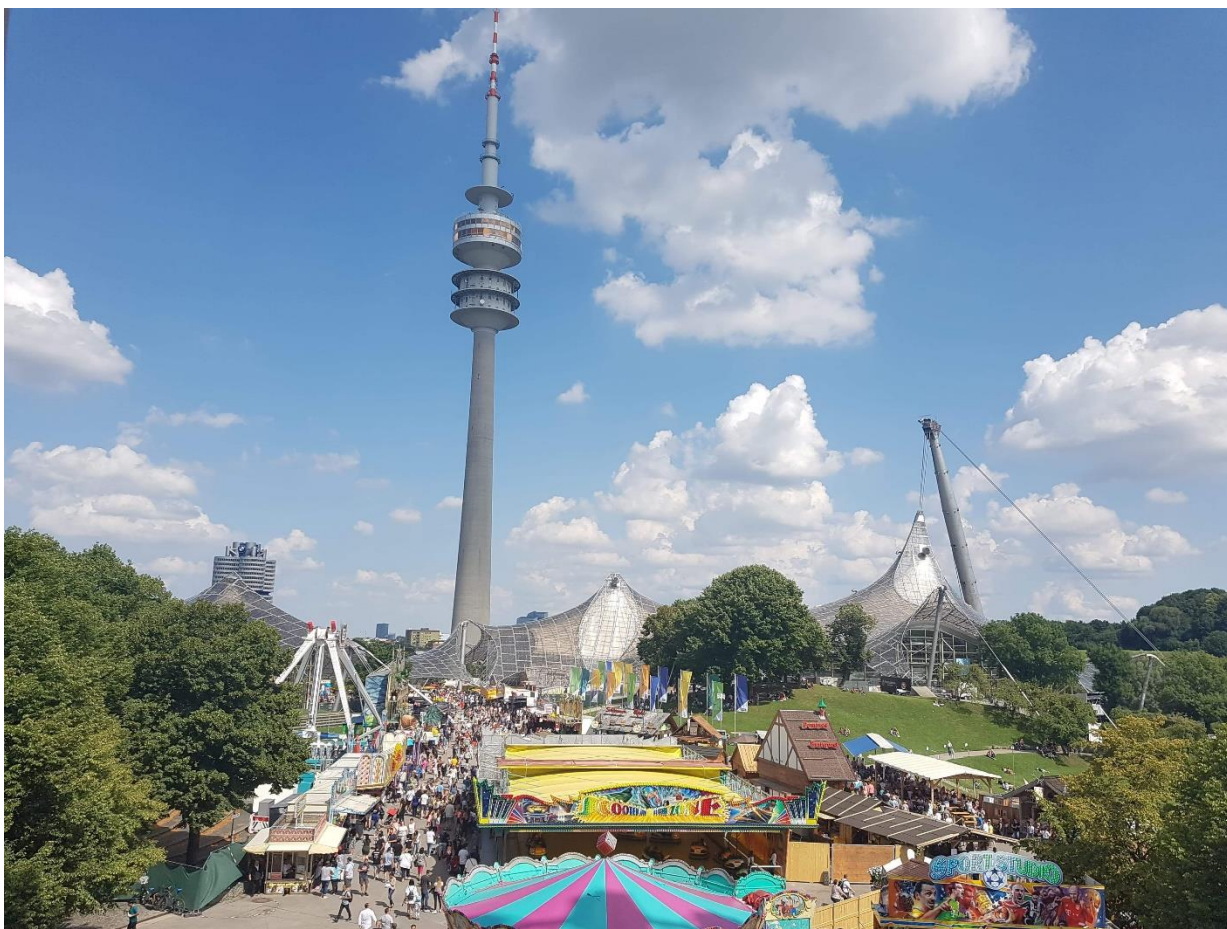
Impark Sommerfestival, München

Ogârcin Loredana Anul 5, seria D, gr. 36