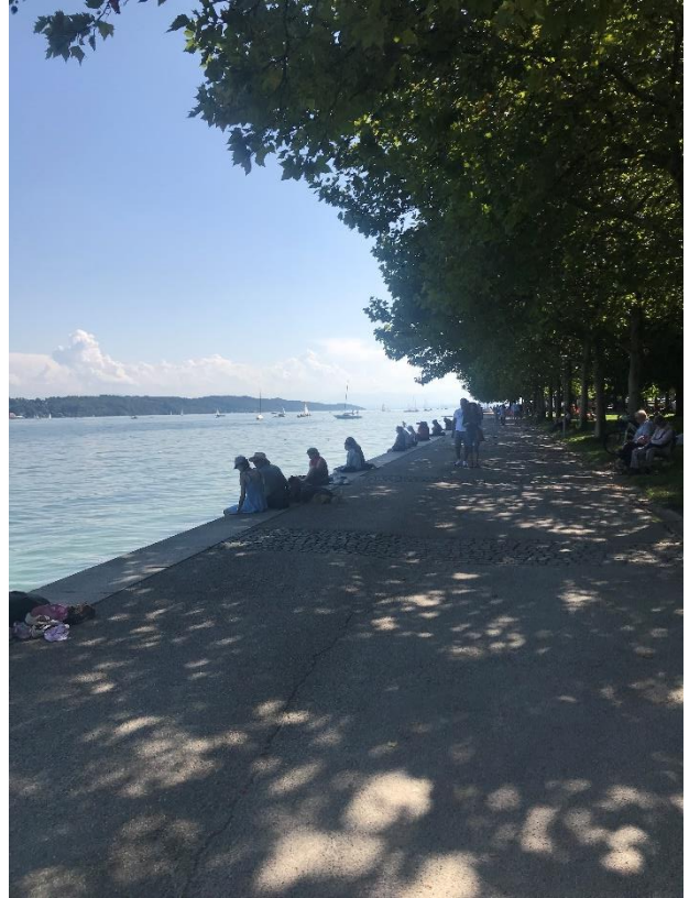
Pe malul lacului Starnberg, München