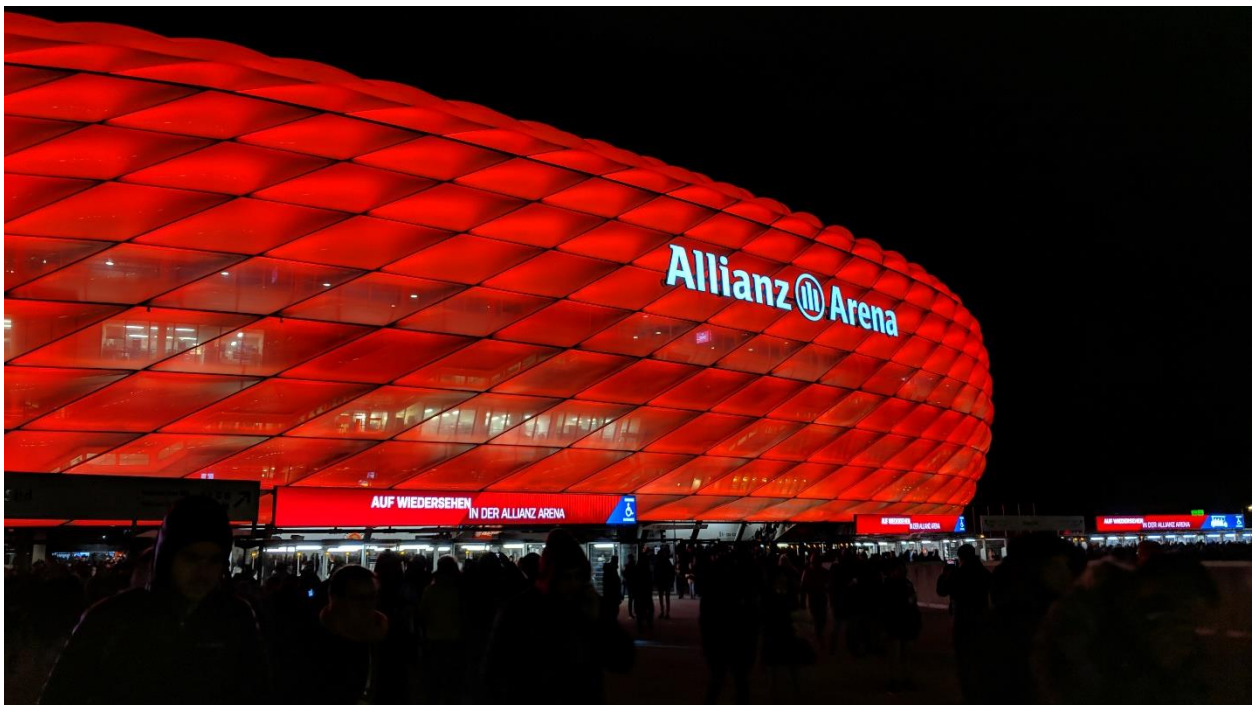
Allianz Arena, München