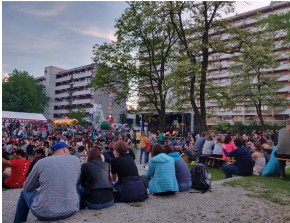
Festivalul Stustaculum in Studentenstadt, München, organizat doar de studenți