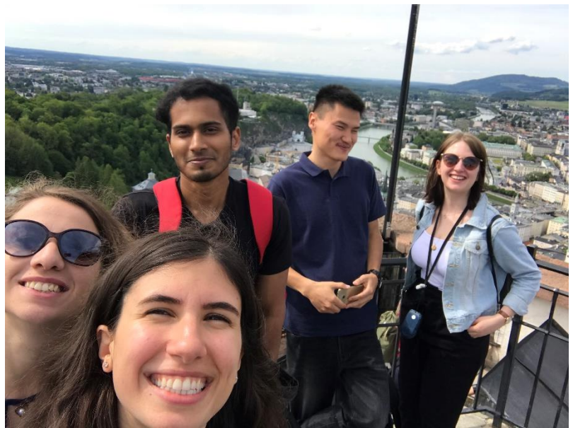
Excursie cu ESN MESA la Salzburg, Austria