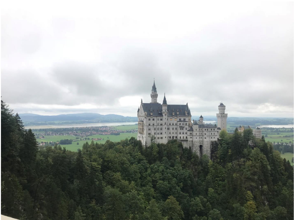
Castelul Neuschwanstein, Schwangau

Legat de programul social oferta este foarte mare în München. Pentru studenții Erasmus se organizau multe evenimente și excursii de către ESN MESA și TUMi, având o dată la câteva zile sau uneori în fiecare zi câte un eveniment interesant și la prețuri reduse. Astfel am învățat mai multe despre tradițiile germane și bavareze dar și despre alte țări și culturi prin ceilalți studenți Erasmus. Era imposibil să te plictisești sau să spui că nu este nimic de făcut. De asemenea de la începutul semestrului am fost atribuită unui „Study-buddy”, un student al LMU care te poate ajuta cu toate întrebările sau neclaritățile care mai apar pe parcurs. Desigur pe lângă acest lucru am legat una din multele prietenii strânse care mă leagă de acest oraș.