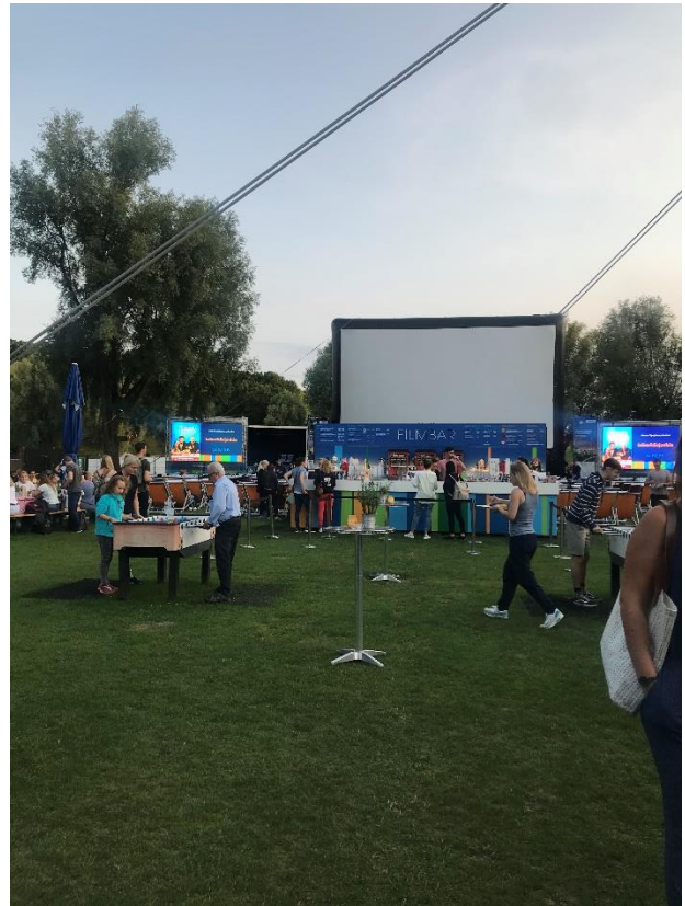
Cinema in aer liber in Olympiapark, München