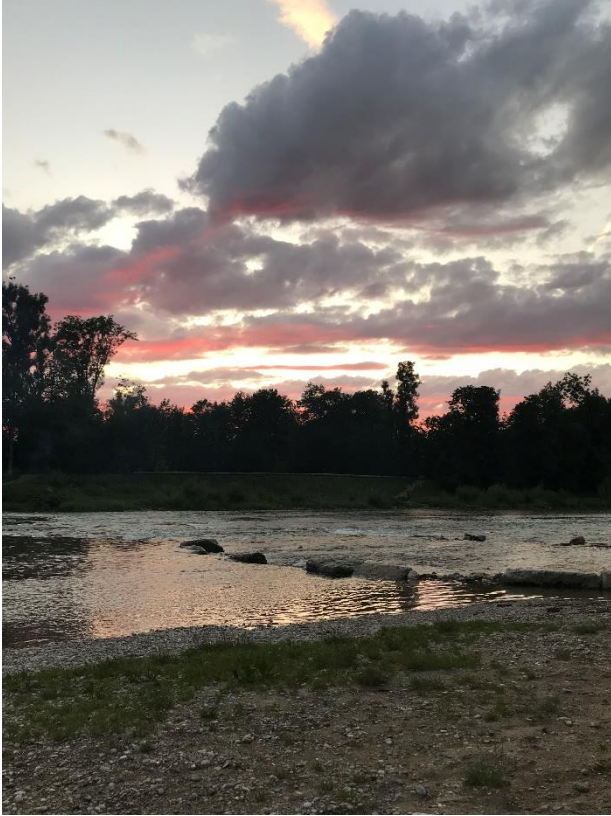
Pe malul râului Isar, München