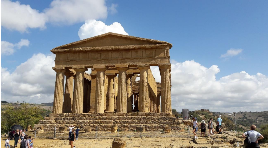
Valle dei templi, Agrigento