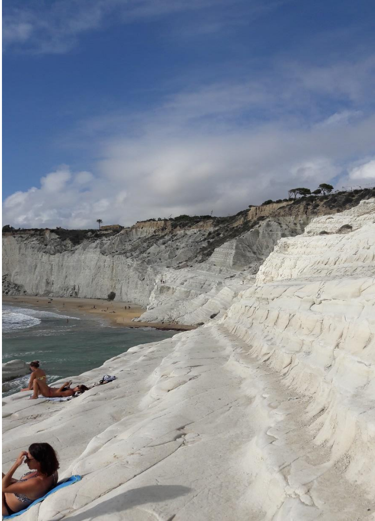
Scala dei turchi, Sicilia

ESN ( Erasmus Student Network) Palermo a avut grija ca experienta noastra Erasmus sa fie presarata cu amintiri placute: excursii, beer-pong, seara de karaoke, seri culinare, spectacole de opera, petreceri, etc.