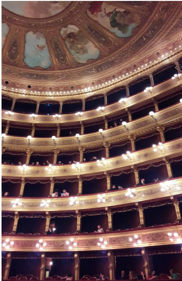
Teatro Massimo Palermo( a 3-a cea mai mare opera din Europa)