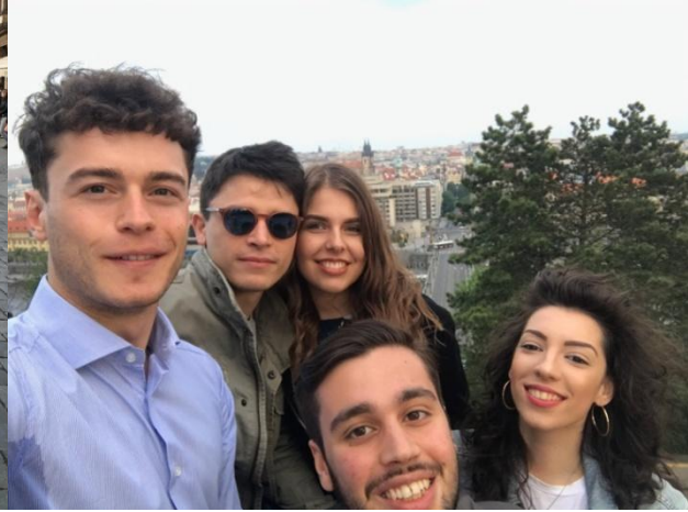
Praga, Mai 2019