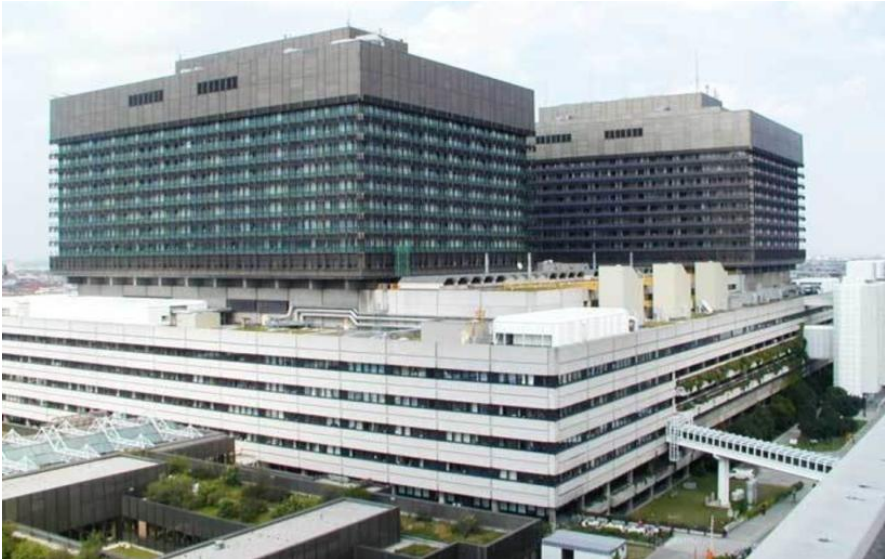
Spitalul AKH ("Allgemeines Krankenhaus der Stadt Wien")